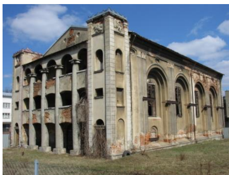
בית הכנסת עומד חרב לאחר המלחמה